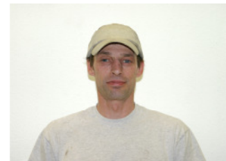
Armin Kettner Auftragsannahme & Disposition

Tel: +41 (0)61 465 92 00 Fax: +41 (0)61 465 92 09 kettner@meyer-spinnler.ch